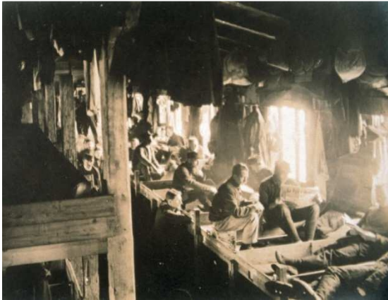
Kriegsgefangenenunterkunft im ersten Weltkrieg: Zweiglager Haaßel.

Gräber für verstorbene Gefangene auf kommunalen Friedhöfen sind heute kaum noch als Gräber von verstorbenen Kriegsgefangenen des Ersten Weltkriegs erkennbar, teils liegen die einstigen Lagerfriedhöfe abseits von Siedlungen im Waldgebiet.