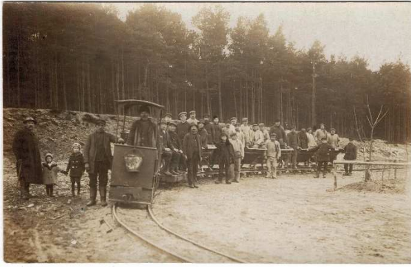
Arbeitseinsatz von Kriegsgefangenen (vermutlich Forstort Anfang). Foto: unbekannt, undatiert. Privatbesitz V. Kullik.